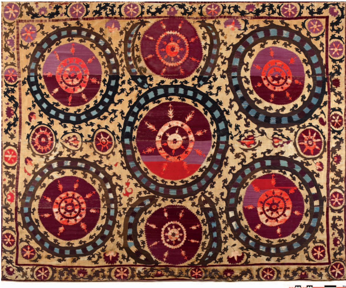
Fig. 11. Ifao, inv. en cours d'attribution . Support en toile de lin (?); broderies en soie. H. 260 cm ; l. 290 cm. Ouzbékistan, Tachkent, seconde moitié du XIX e siècle.

Le décor brodé est réalisé aux fils de soie polychrome (bordeaux de différentes nuances, rouge, bleu, marron-vert et noir ; STA ou STA2S). Il se compose d'un large champ central, cerné par une petite bordure étroite. L'ensemble, à dominante rouge à bordeaux, s'organise autour d'un large disque de part et d'autre duquel se répartissent six éléments similaires, au diamètre légèrement inférieur, se détachant sur le fond en toile écri laissé apparent. Ces disques concentriques présentent tous en leur centre un motif circulaire au cœur duquel apparaît une petite rosace, et d'où rayonnent plusieurs éléments flammés, conférant à l'ensemble