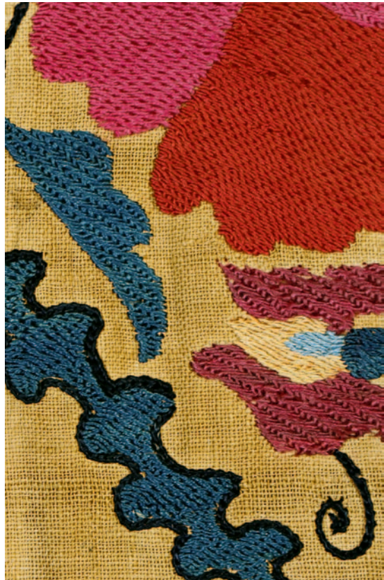
Fig. 8. Ifao, inv. 178. Détail du décor brodé : zones de remplissage réalisées au point de Kansda-Kayol et au point de Basma .