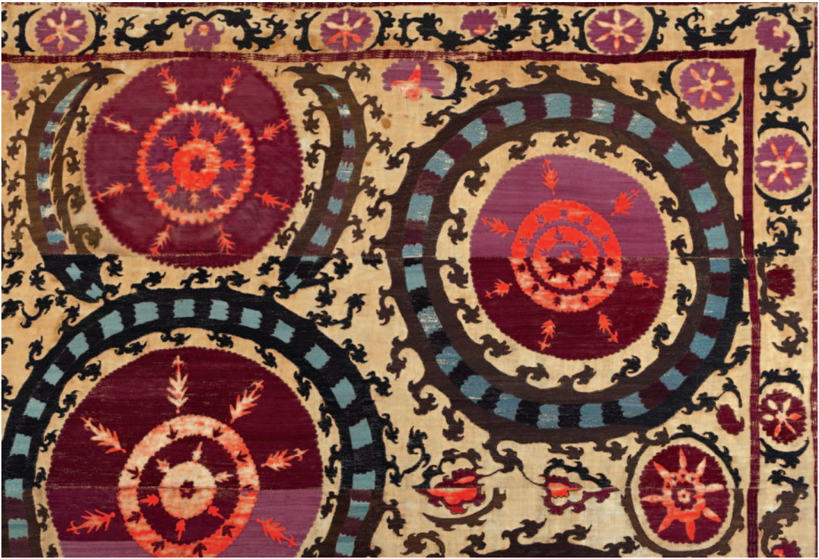
Fig. 12. Ifao, inv. en cours d'attribution. Détail de l'angle supérieur droit.