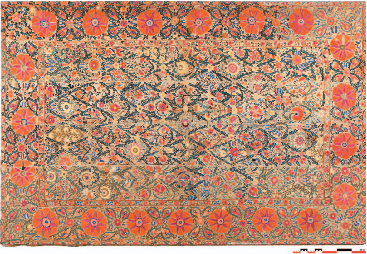
Fig. 15. Ifao, inv. 175. Support en toile de coton; broderies en soie. H. 168 cm; l. 250 cm. Ouzbékistan, Shahrissabz?, fin du xviii e siècle-première moitié du xix e siècle.