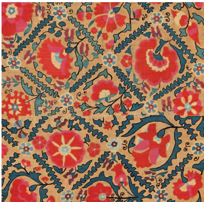
Fig. 6. Ifao, inv. 178. Détail du panneau central.