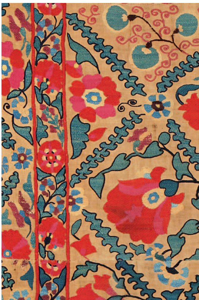
Fig. 7. Ifao, inv. 178. Détail d'une des deux petites bordures, placée ici entre la large bordure (gauche) et le panneau central (droite).