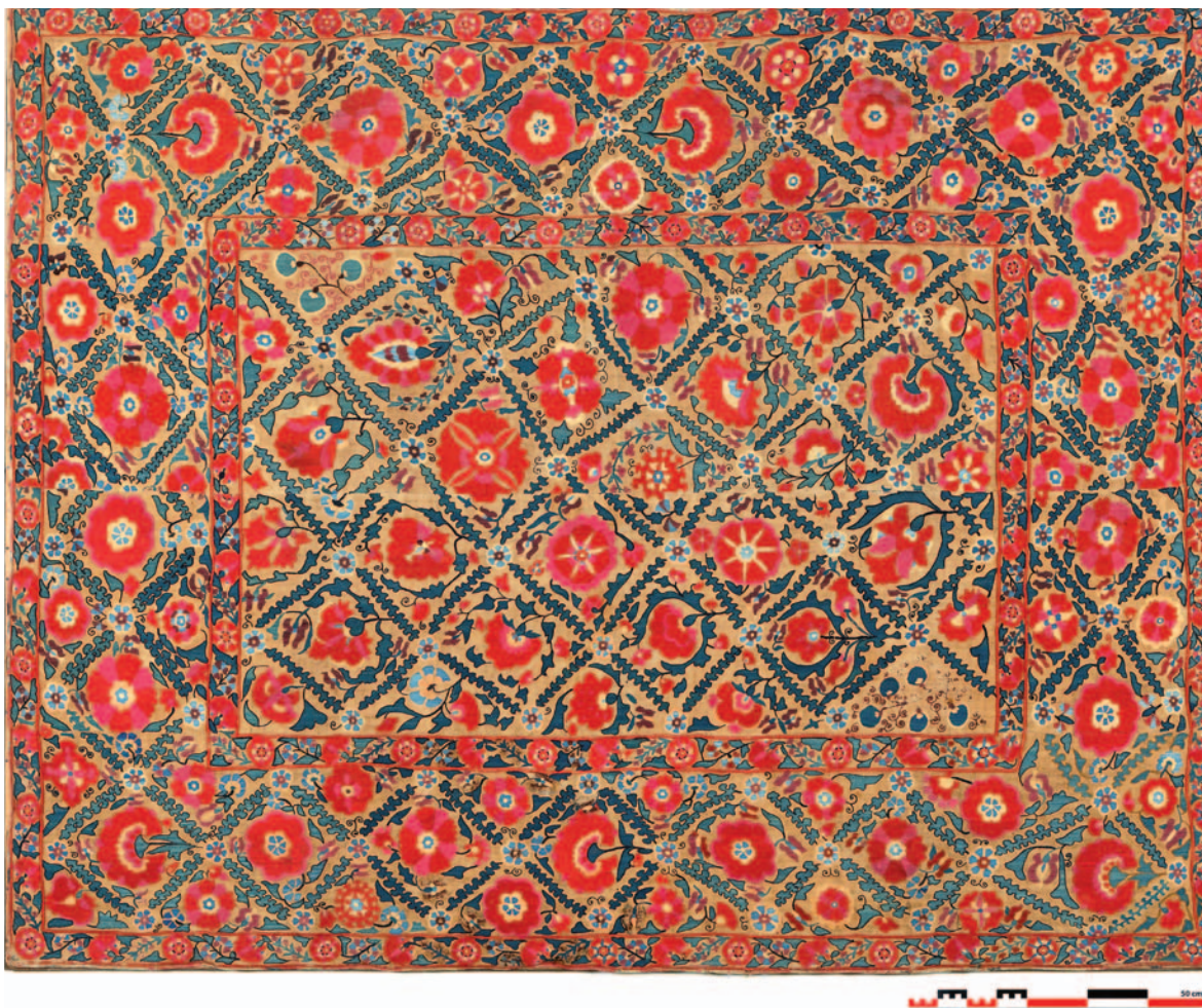
Fig. 5. Ifao, inv. 178. Support en toile de coton ; broderies en soie. H. 160 cm ; l. 205 cm. Ouzbékistan, Nurata?, XIX e siècle. © Institut français d'archéologie orientale, photo : Gaël Pollin.

Le décor, à dominante de rouge et de vert, se répartit sur un champ central rectangulaire, encadré par une large bordure, elle-même ceinte de part et d'autre par deux bandes étroites. Son organisation et sa répartition se veulent identiques sur les deux zones principales de la pièce, lui conférant ainsi un aspect équilibré et unifié, bien que foisonnant. La structure générale