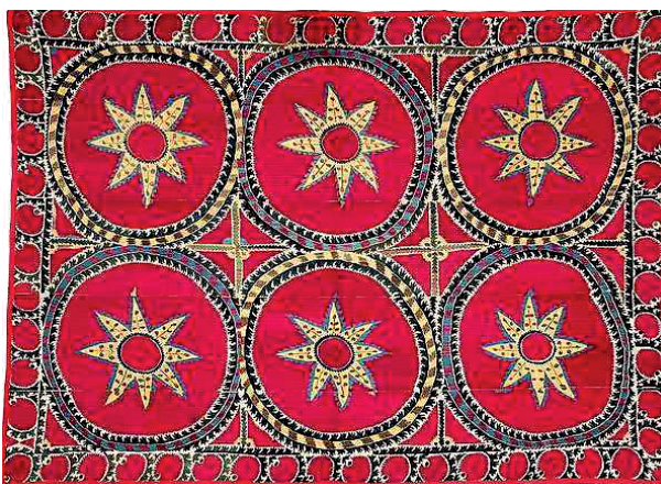
Fig. 14. Collection particulière. Support en toile de coton ; broderies en soie. H. 189 cm ; l. 263 cm. Ouzbékistan, Tachkent, fin du XIX e siècle.