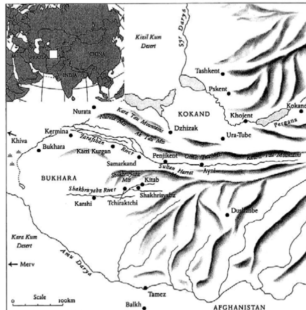
Fig. 1. Carte d'Asie centrale (actuel Ouzbékistan). D'après Franes, Suzani , p. 14.

à l'est par la Chine et à l'ouest par l'Iran. La production des suzanis se serait développée autour de deux rivières : la rivière Amou-Daria (antique Oxus), dans les villes de Boukhara, Kermine, Samarcande et Shahrissabz, et la rivière Syr-Daria (antique Jaxartes), dans celles de Tachkent, Pskent, Kokand et Khodjent (fig. 1) 3 .