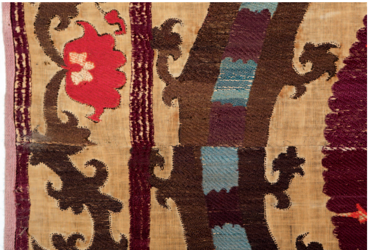
Fig. 13. Ifao, inv. en cours d'attribution. Détail du décor brodé à la jonction de deux bandes en toile de lin : zones de remplissages réalisées au point de Basma et au point de Kansda-Kayol , motifs ceints au point de Yurma .