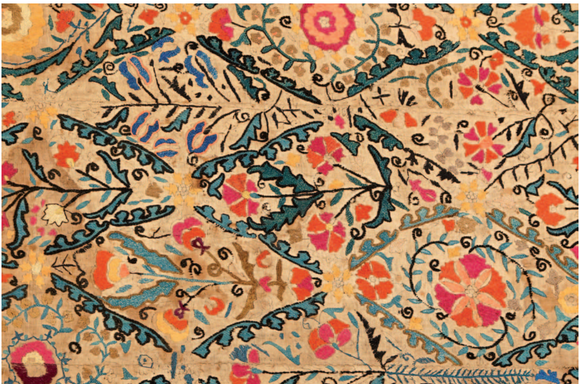
Fig. 16. Ifao, inv. 175. Détail du panneau central.