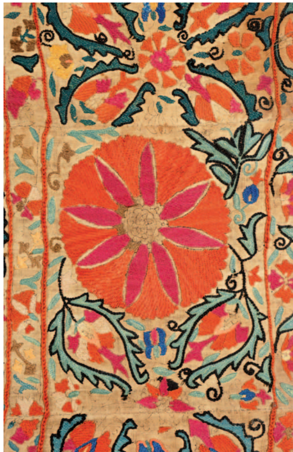
Fig. 17. Ifao, inv. 175. Détail de la bordure.

L'ensemble du décor de ce suzani a été réalisé en ayant recours au point de Basma et au point de Kansda-Kayol pour les éléments décoratifs et les zones de remplissage, et au point de chaînette (point de Yurma ), parfois remplacé par le point de Tambour , pour cerner les motifs et constituer les petites bandes rouges délimitant les différentes bordures de la pièce (fig. 4a, 16 et 17). De façon plus ponctuelle enfin, un point de feston double a été utilisé pour la réalisation des petites feuilles bleues ou vertes denticulées.