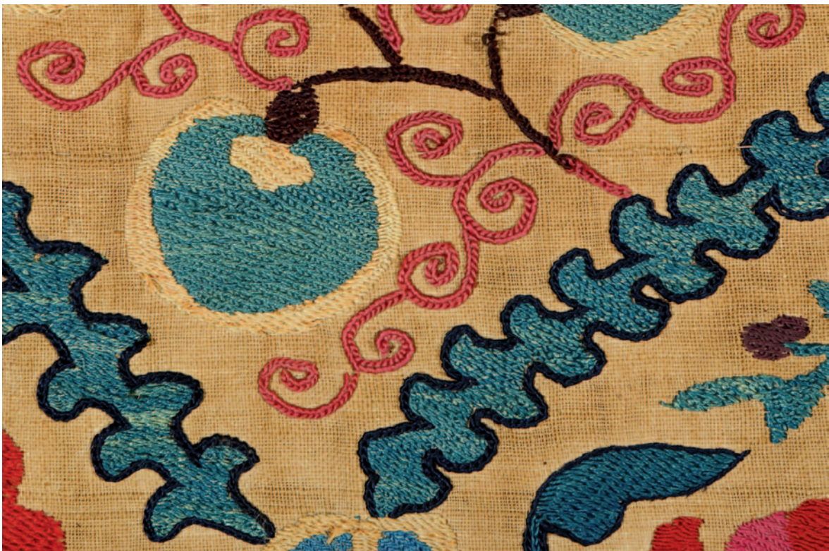
Fig. 9. Ifao, inv. 178. Détail du décor brodé : volutes réalisées au point Ilmok .