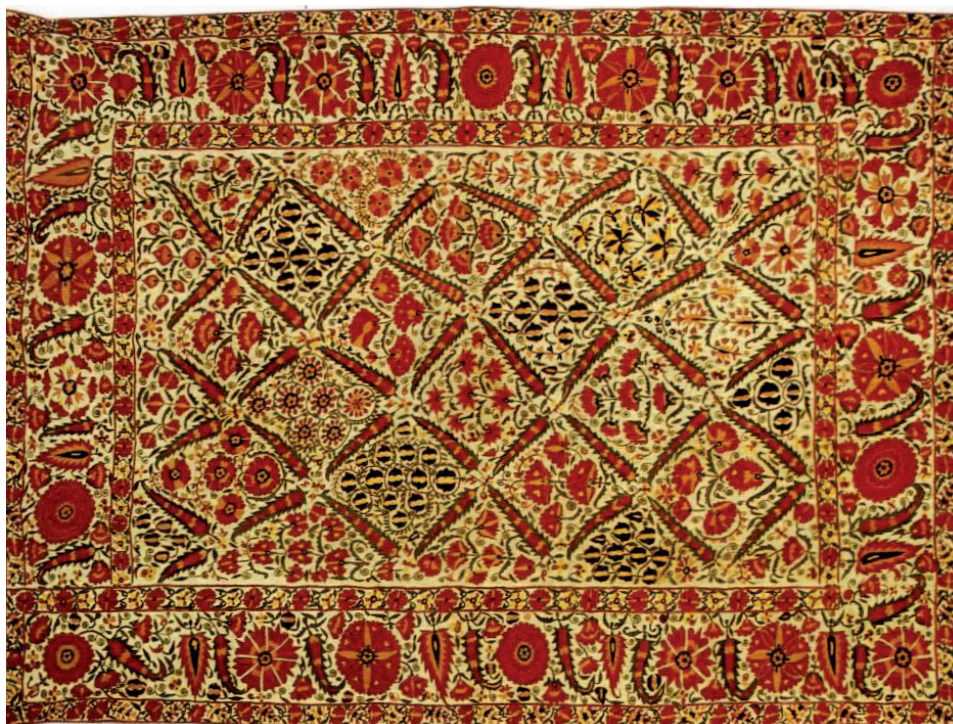
Fig. 10. Samarkand State Museum of History and Architecture, Inv. no. KP1402 75-100. Support en karboz de coton; broderies en soie. H. 170 cm; l. 230 cm. Ouzbékistan, Nurata, milieu du XIX e siècle.

Par la nature de son décor et son traitement, ainsi que par ses caractéristiques techniques de confection, le suzani Inv. 178 de l'Ifao peut être rapproché d'une autre broderie, conservée au Samarkand State Museum of History and Architecture, Ouzbékistan (fig. 10; Inv. no. KP1402 75-100). Cette broderie, originaire de la région de Boukhara et plus précisément de celle de Nurata, aurait été confectionnée au cours du XIX e siècle. À l'image des suzanis produits dans cette région, elle est remarquable par ses couleurs vives à dominante de rouge et de rose ponctuées par des touches de jaune et de bleu, ainsi que par ses motifs floraux et végétaux au traitement précis, délicat et naturaliste, reflétant une certaine influence de l'Inde moghole 24 . En outre, la structure générale du décor s'articule ici, de façon traditionnelle, autour d'un panneau quadrangulaire orné de gerbes de feuilles ou de rameaux fleuris rayonnant en diagonales afin de créer des losanges au cœur desquels diverses fleurs viennent prendre place. Une bordure faite de rangées de grandes et petites fleurs entourées de volutes de feuillages vient enfin ceindre l'ensemble 25 . De telles similitudes entre le suzani conservé au Samarkand State Museum et celui de l'Ifao nous permettent de proposer de rattacher ce dernier aux productions de la région de Boukhara, et plus précisément de celle de Nurata, et de lui attribuer une date de confection similaire, au cours du XIX e siècle.