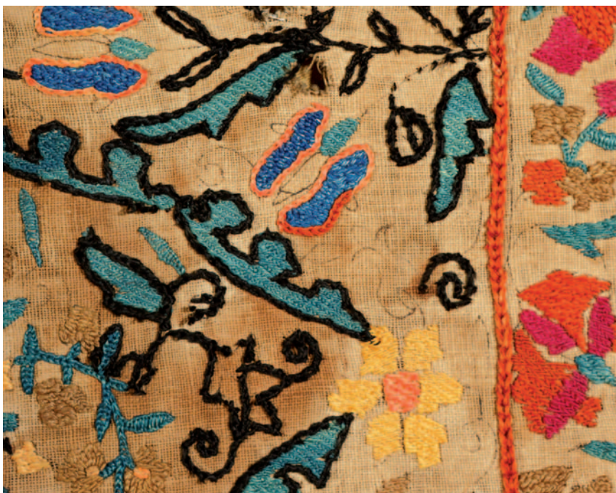
Fig. 18. Ifao, inv. 175. Détail du décor brodé sous et à proximité duquel le dessin préparatoire tracé à l'encre noire est encore visible.